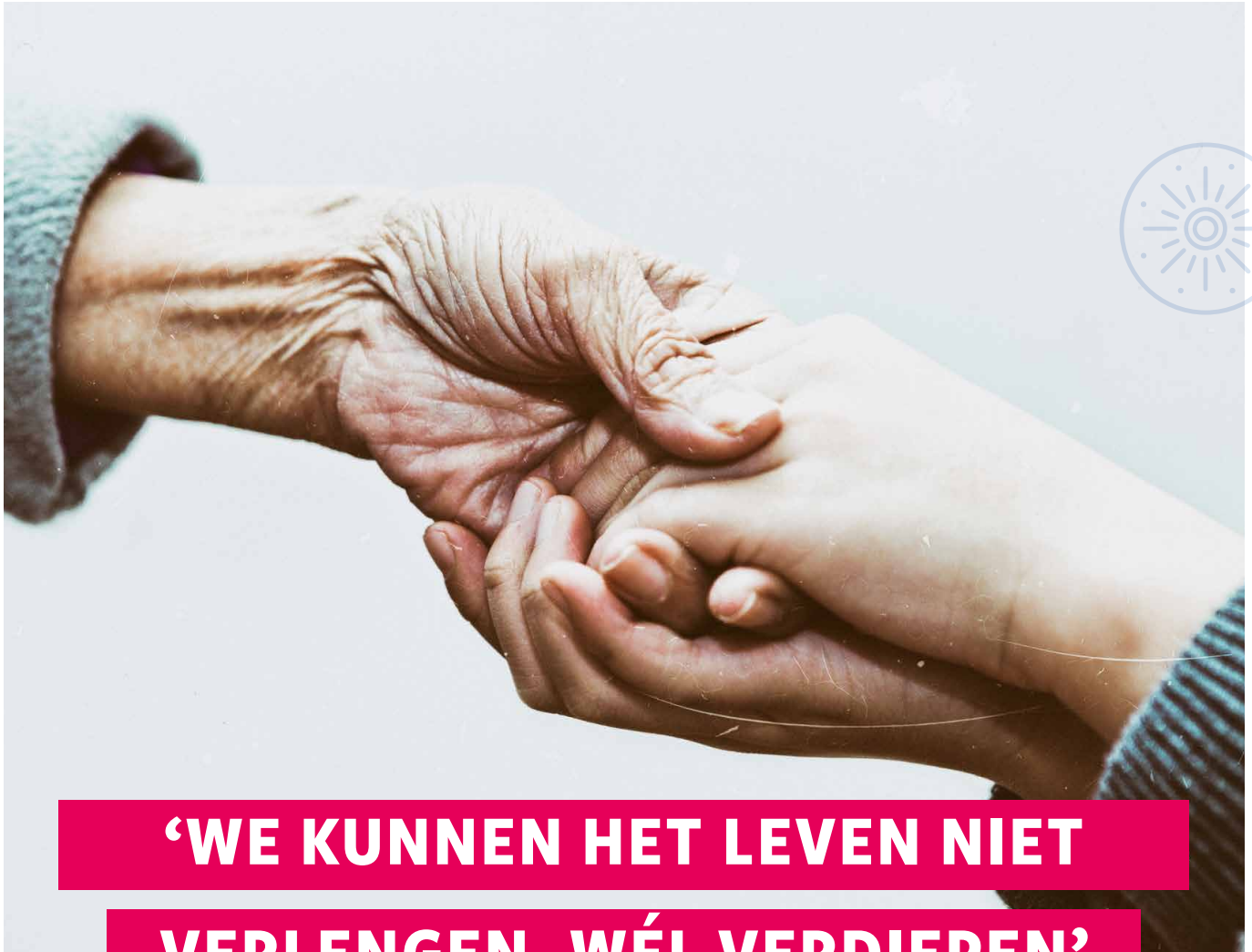
Alle beelden in dit artikel zijn ter illustratie.